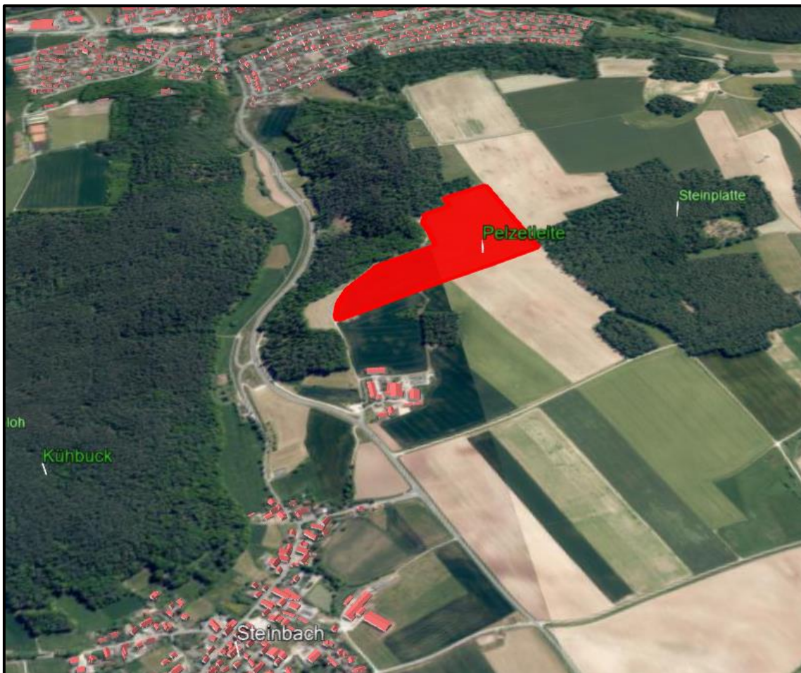
Abbildung 7: Lage und Topographie der Anlage im Raum