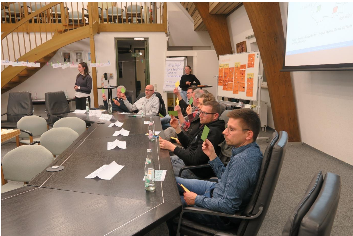
Abbildung 5: Feedbackrunde

Nürnberg, 30.01.2026, PLANWERK Stadtentwicklung