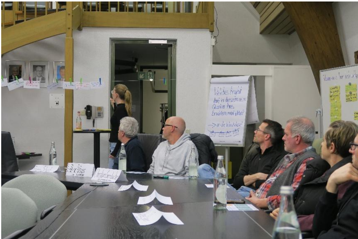
Abbildung 1: Vorstellung der Antworten auf die Frage „Welches Angebot darf Ihres Erachtens im neuen Quartier nicht fehlen?“